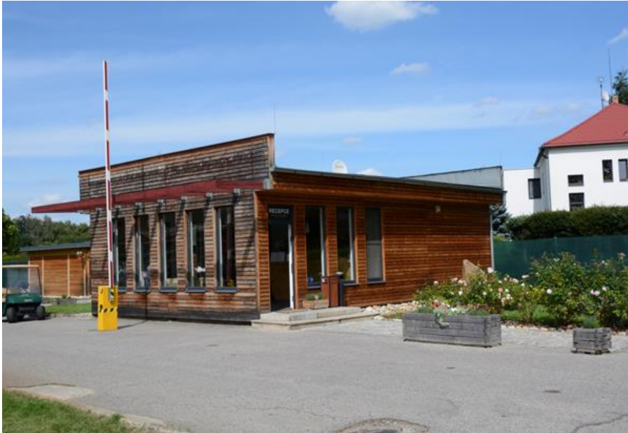
Camping Dlouha Louka, Budweis / 20. – 21.8.2016