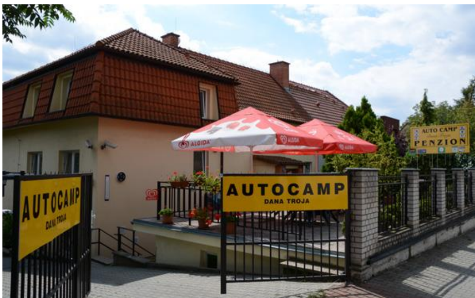
Camping Dana Troja, Prag / 15. – 18.8.2016

Wir verlassen Marienbad nach einer Nacht wieder und fahren 170km bis nach Prag zum Camping Dana Troja. Der Camping ist nur 7km vom Prager Zentrum entfernt und in unmittelbarer Nähe befindet sich eine Haltestelle vom Tram der Linie 17.