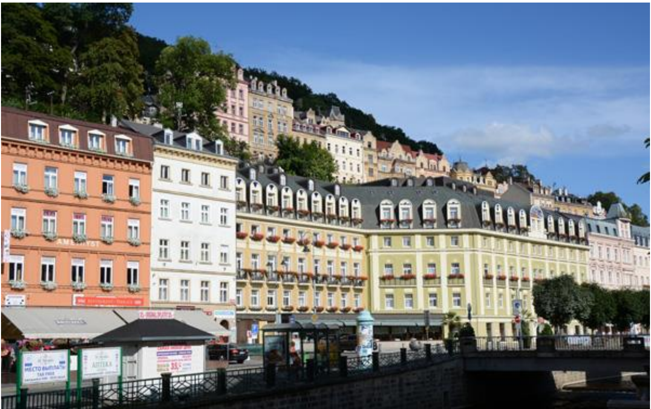
Camping Sasanka, Sadov bei Karlsbad / 13. – 14.8.2016

Von Annaberg fahren wir nach Sadov bei Karlsbad. Kurz nach der Ankunft im Campingplatz Sasanka fahren wir mit den Bikes, bei sehr gutem Wetter und angenehmen Temperaturen, zur Stadt Karlovy Vary/Karlsbad. Karlsbad ist eine sehr sehenswerte und schöne Stadt und hat viele warme Quellen und Heilbäder.