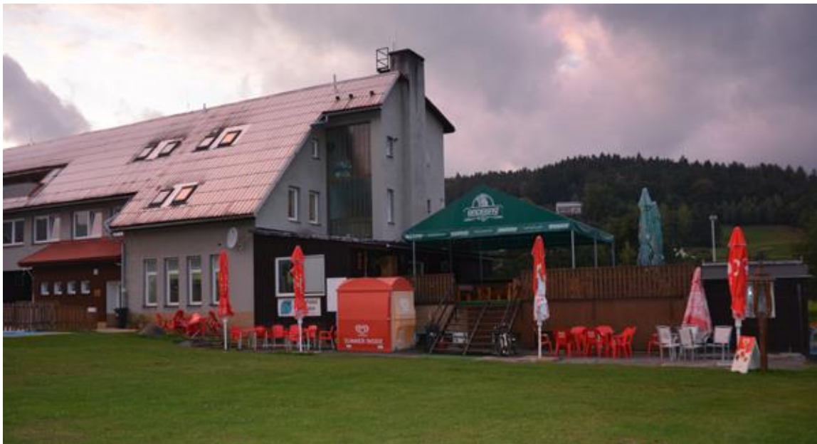
Euro-Camp, Hutisko-Solanec / 22. – 23. August 2016

Nach der Besichtigung der Katharinenhöhle fahren wir via Olmütz und Roznov in den Osten der tschechischen Republik bis nach Hutisko-Solanec. Wir stoppen im Euro-Camp für eine Nacht.