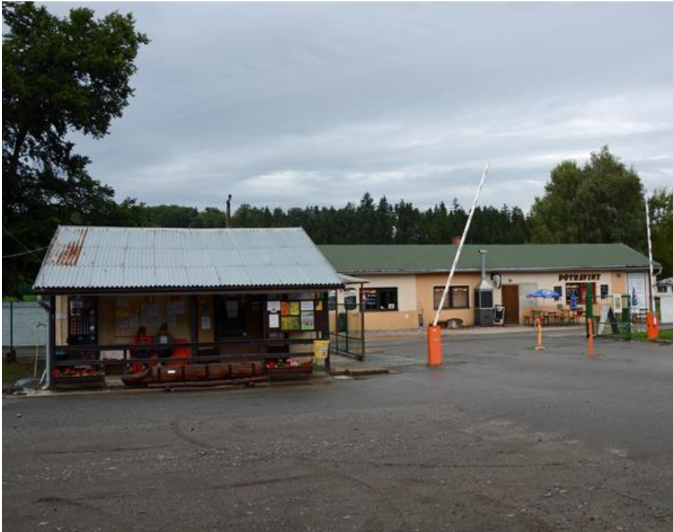
Camping Olsovec, Jedovnice / 21. – 22.8.2016

Der in Brünn geplante Campingplatz Radka war aufgrund vom regnerischen Wetter sehr nass, schmutzig und wegen der extremen Hanglage für unsere Womos nicht befahrbar. Wir fahren weiter nach Norden bis zur Ortschaft Jedovnice und übernachten im Camping Olsovec.