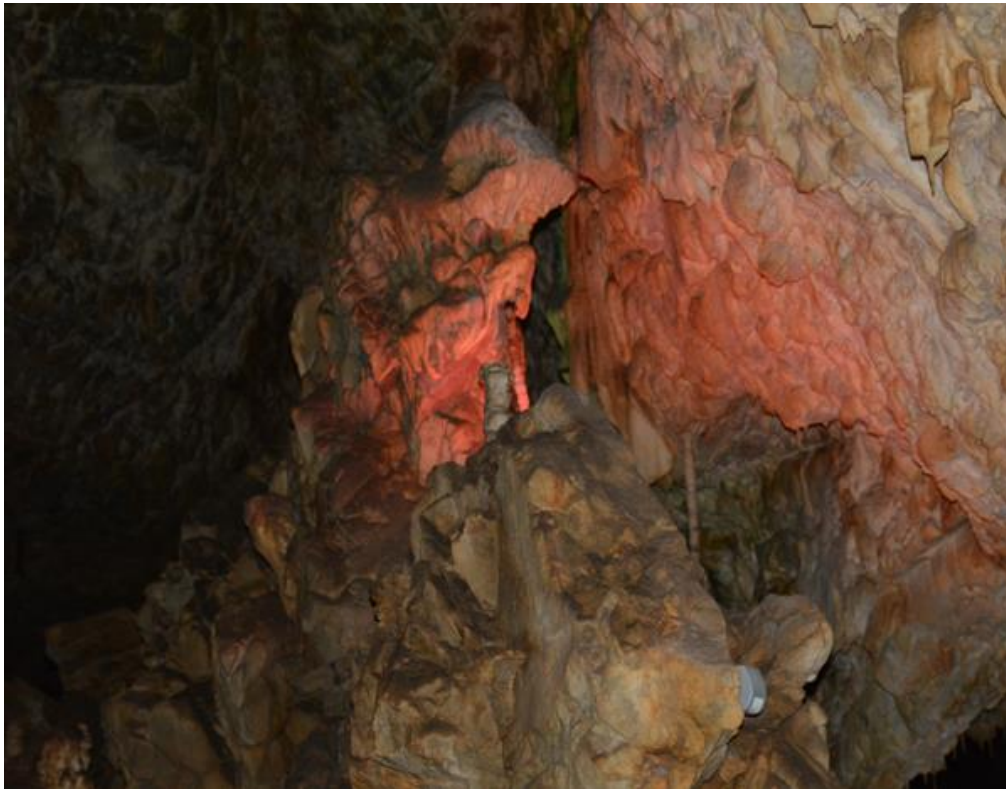
ähnelt wirklich einer Hexe

Nach der Besichtigung der Katharinenhöhle fahren wir via Olmütz und Roznov in den Osten der tschechischen Republik bis nach Hutisko-Solanec. Wir stoppen im Euro-Camp für eine Nacht.