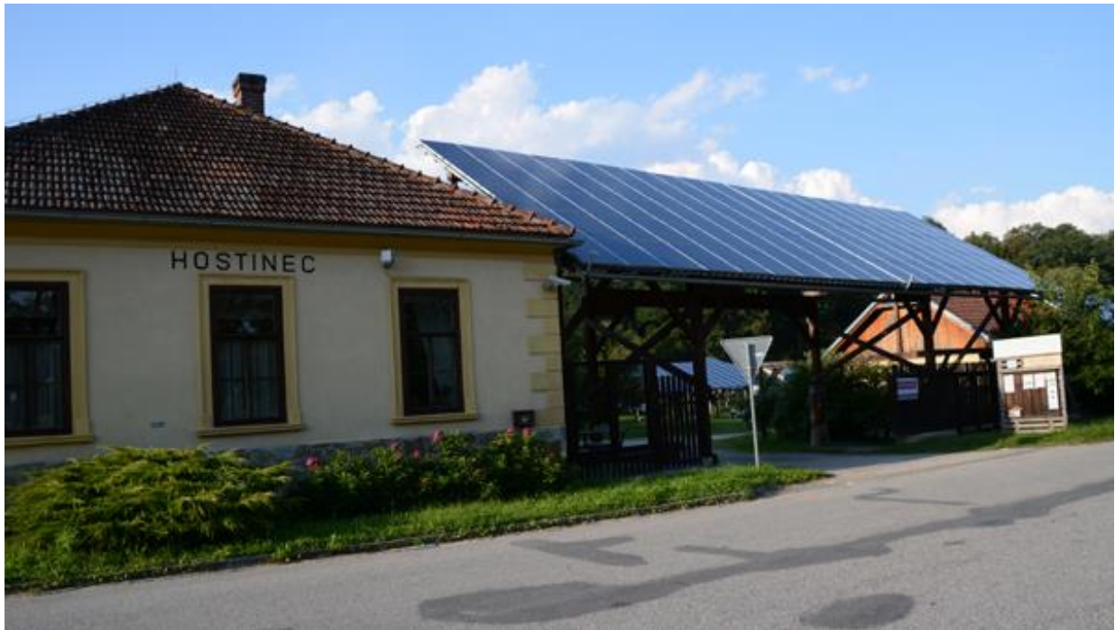
Camping Petraskuv Dvur, Kajov bei Ceske Krumlov / 18. – 20.8.2016

Wir stoppen für 2 Tage im Camping Petraskuv Dvur in Kajov, ca. 3km von Ceske Krumlov entfernt.