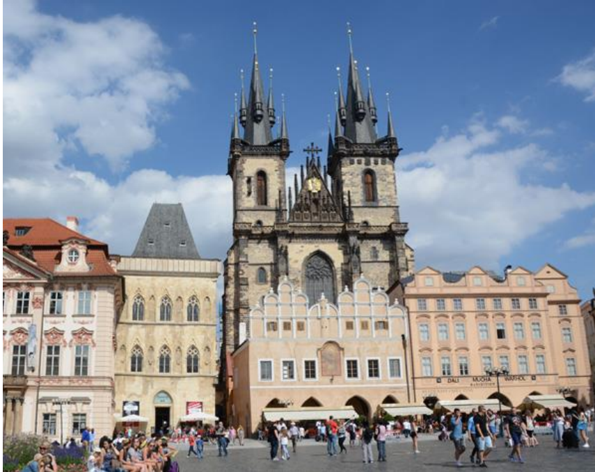
katholische Teynkirche der Jungfrau Maria

Wir stoppen 3 Tage in Prag und besichtigen am Ankunftstag in der Innenstadt den Altstädter Ring beim Rathaus, die um 1380 erbaute „Kirche der Jungfrau Maria vor dem Teyn“ und laufen danach noch zur Karlsbrücke/Karluv most.