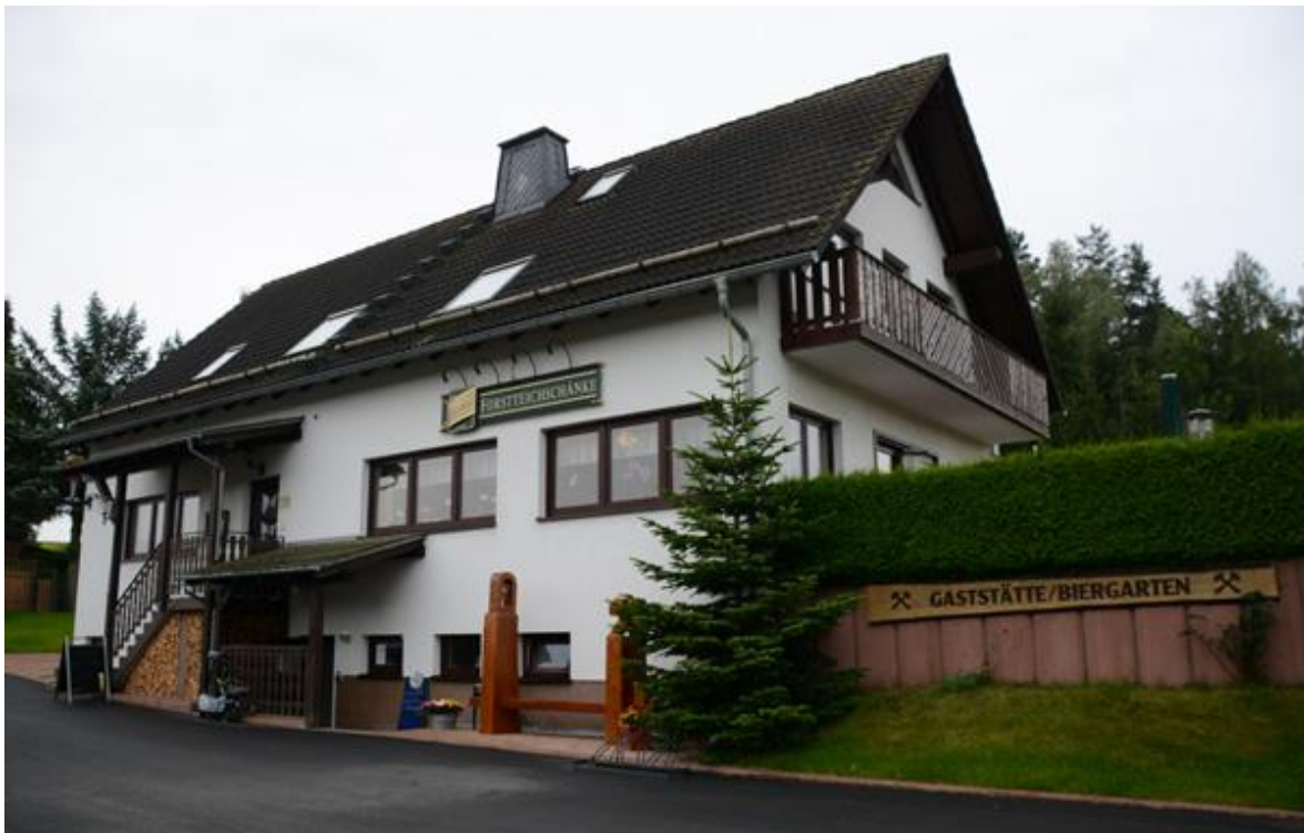
Camping Lindenau, Schneeberg / 12. – 13.8.2016

Wir bleiben somit noch eine weitere Nacht in Deutschland und übernachten im Camping Lindenau in Schneeberg in der Nähe von Annaberg-Buchholz. Am Abend haben wir hier in Schneeberg immer wieder Regen.