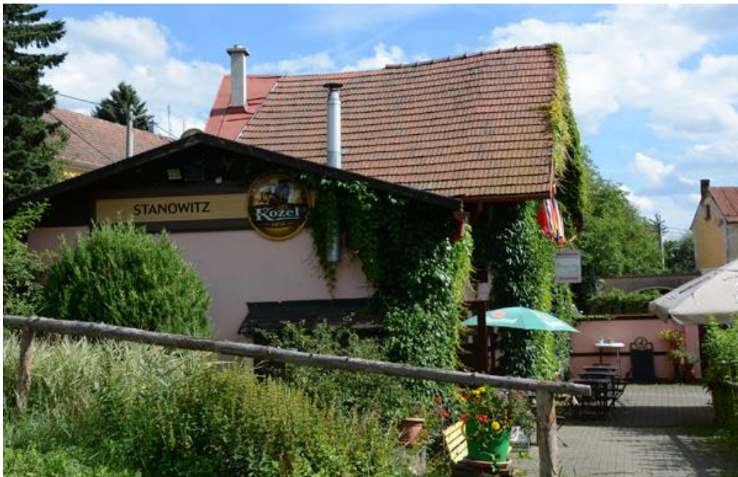
Camping Stanowitz, Marienbad / 14. – 15.8.2016

Bei sehr gutem Wetter besichtigen wir die Stadt Marienbad oder mit tschechischem Name Mariànske Làsne. Marienbad ist ebenfalls eine sehr schöne Stadt und es gibt, wie in Karlsbad, viele warme Quellen.