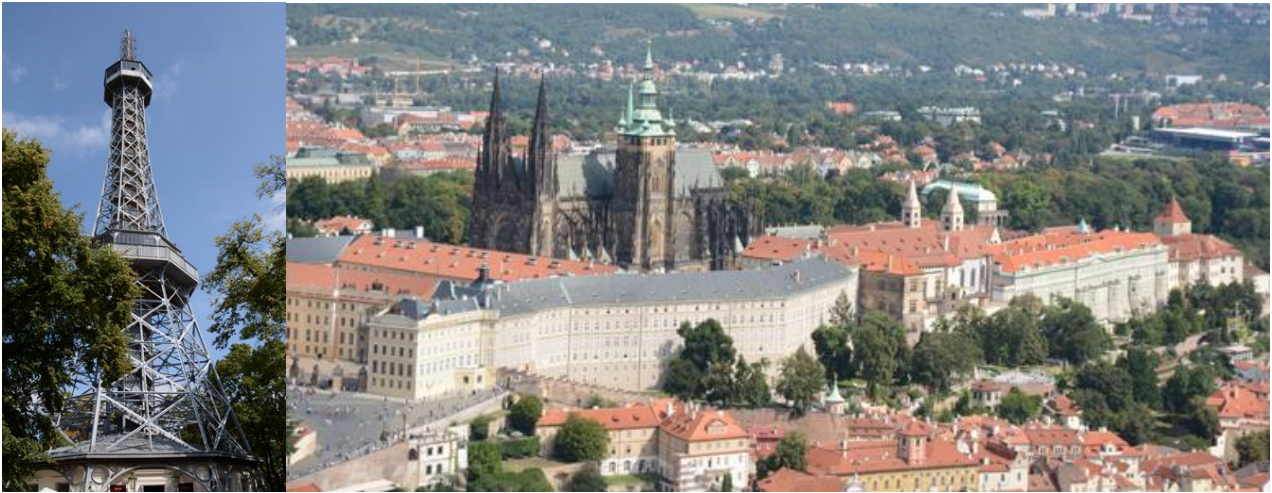
Blick vom Aussichtsturm Petřin auf die Prager Burg mit dem Veitsdom

zwei Aussichtsplattformen auf 20 und 60 Meter. Super Ausblick über Prag von der oberen Plattform.