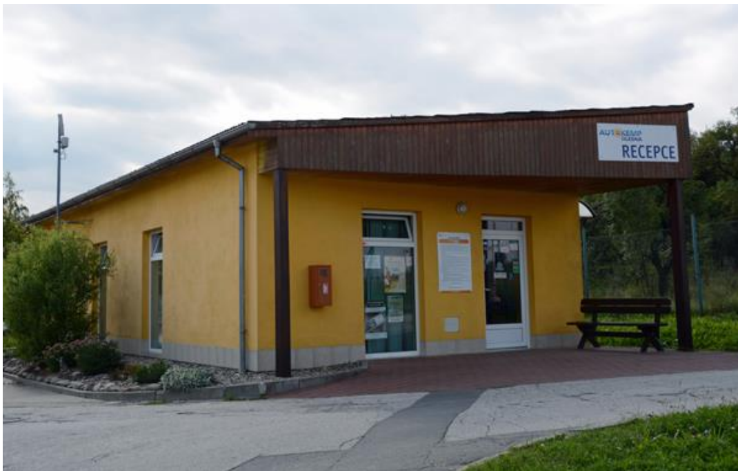
Camping Olesna, Frydek-Mistek / 23. – 24. August 2016