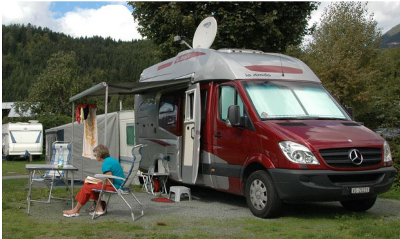
Camping Schluga, Hermagor – 18.-20.9.13

Morgen geht unsere Reise weiter nach Sankt Johann in Tirol zum Knödeltisch 2013.