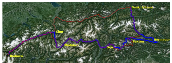
Unsere Route bis Sankt Johann in Tirol

Im Camping Schluga in Hermagor haben wir 2 Tage/Nächte verbracht. Im Camping hatte es es zudem noch ein sehr schönes geheiztes Schwimmbad. Auf dieser Reise mit Nordy haben wir in Sexten aber auch hier in Hermagor sehr viel im warmen Wasser gebädelt.