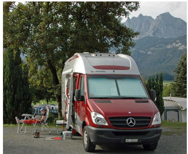
Camping Michelnhof, St. Johann – 20.-25.9.13