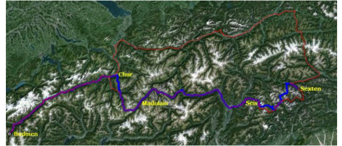
Unsere Route in blau bis Sexten

Ankunftstag um 20h war noch ca. 11 Grad.