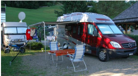
Camping Seiseralm – 3.9.13-10.9.13

Unterwegs in Glurns mussten wir mitten im Dorf unser Fahrzeug wieder einmal wenden, weil vor der Ausfahrt in Richtung Schluderns die Höhe auf 2,8m (Nordy ist 3,25m) begrenzt war. Nach kurzer Suche haben wir das 2te Stadttor in Richtung Reschenpass gefunden, welches dann mit den 3,5m auch für Nordy passte.