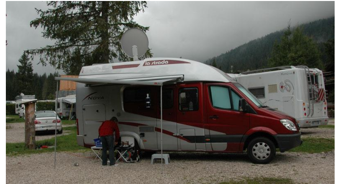
CaravanPark Sexten – 10.9.13-18.9.13

Nach dem Rundgang auf der Seiseralm gab es in Compatsch auch noch eine neue Wanderhosen.