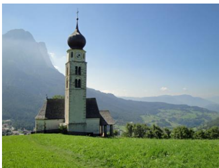
Kirche von St. Valentin

Wir haben im Kastelruth bei gutem Wetter verschiedene Wanderungen rund um den Schlern unternommen.