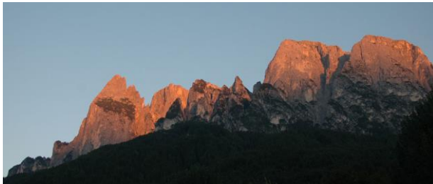
Sonnenuntergang in Seis am Schlern

Wir haben im Kastelruth bei gutem Wetter verschiedene Wanderungen rund um den Schlern unternommen.