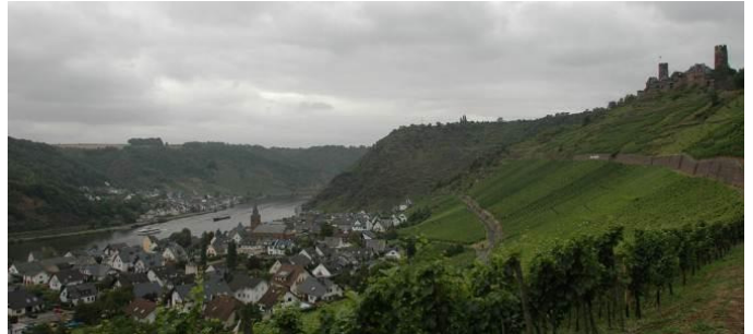
Burg in der Nähe von Koblenz am Rhein