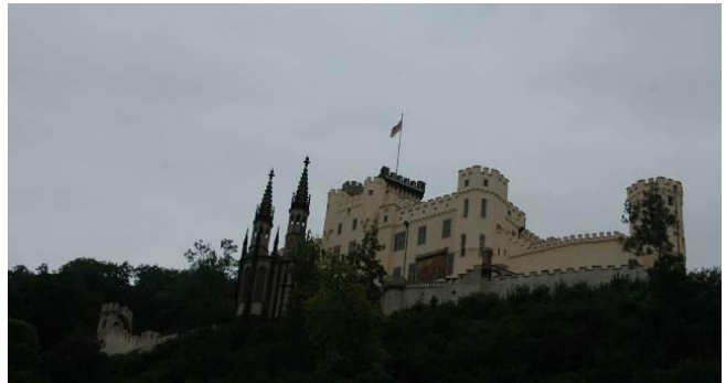
Burg in der Nähe von Koblenz am Rhein