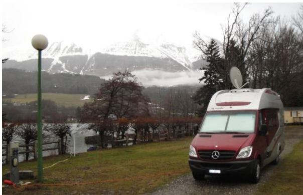
Camping Au Bord du Lac – 28.3.13

Erste Übernachtung bei St. Theoffrey in der von Nähe von Grenoble im Camping Au Pre du Lac- waren noch nette Wirte.